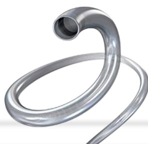
AXS Vecta® Aspiration Catheter